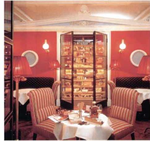
Festlich eingedeckt im stilvollen Restaurant. Im Zigarrenkabinett lagern über 100 verschiedene Zigarrensorten (ganz rechts).

erlernt, zunächst als Koch-Azubi in Vincent Klinks Stuttgarter „Wielandshöhe“, dann im Service im benachbarten „Brenner's Park-Hotel & Spa“. Weitere erstklassige Stationen waren das „Turnberry Hotel Golf Courses Spa“, das „Hotel Bareiss“ in Baiersbronn und zuletzt wiederum das „Brenner's“, für das Verscht als Direktionsassistent zwei Jahre verantwortlich zeichnete.