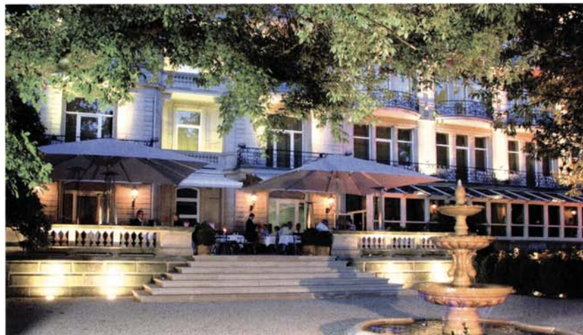
Abendstimmung auf der „Alleeterrasse“: Genießer schätzen die mediterrane Atmosphäre.

Unser kulinarisches Reiseziel ist mit dem vornehmen Haus aus der handverlesenen Oetker Hotel Collection nicht nur aufgrund der prominenten Lage an der Lichtentaler Allee eng verbunden. Der großzügige Restaurant-Komplex „Medici“ wurde nach dem Zweiten Weltkrieg für 10 Jahre Hauptquartier der französischen Besatzungsmacht – ehe der Haupt-