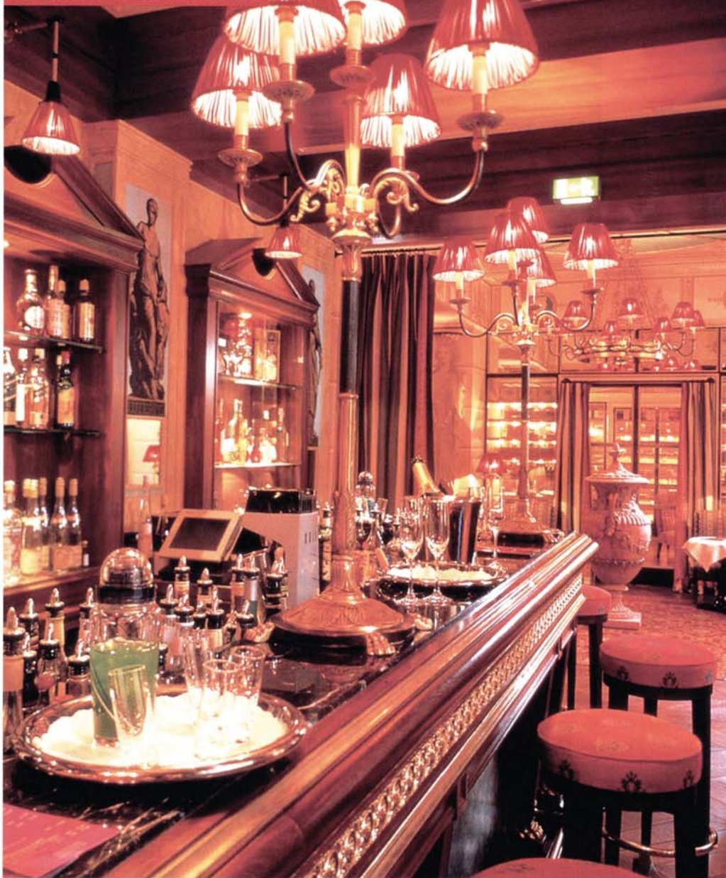
Die opulent ausgestaffierte Bar lädt zum Verweilen.

bau dem an seiner Stelle errichteten Kongresshaus weichen musste. Schließlich war es der einflussreiche Medien-Macher Karlheinz Kögel, der das repräsentative Gebäude erwarb, sanierte und zum Sitz seines Firmenimperiums machte. Im Erdgeschoss eröffnete der Begründer von „Media Control“ im Februar 1998 das „Medici“. Ein Glücksfall für all jene, die erlesene Gastlichkeit, kombiniert mit anspruchsvoller Küche, schätzen. Längst ist das „Medici“ in der mondänen Kurstadt ein urbaner Hot Spot.